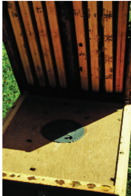
Eine Bienenflucht erleichtert die Honigernte (hier die Unterseite).

werden. Reif bedeutet, dass der Wassergehalt des Honigs maximal 18 % beträgt. Deshalb vor der Honigernte die Reife prüfen.