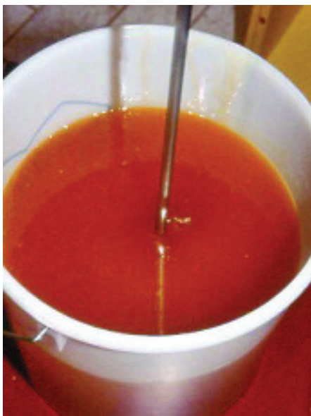
Das Rühren des Honigs erzielt einen feincremigen, streichfähigen Honig. Darauf achten, dass keine Luft eingegrührt wird.

Sowohl der Schleuderraum als auch die Räume zur weiteren Verarbeitung von Honig müssen den Anforderungen der Lebensmittelhygieneverordnung entsprechen. Böden und Wände müssen abwaschbar sein, die Decke frei von Teilen, die sich lösen könnten. Der Raum muss trocken und unbedingt bienendicht sein. Zur Reinigung der Geräte und der Schleuder darf nur Trinkwasser verwendet werden. Selbstverständlich muss der Schleuderraum vor Einsetzen in eine gründliche Reinigung unterzogen werden. Haustiere dürfen keinen Zugang zu Schleuder- und Verarbeitungsräumen haben. Auch die persönliche Hygiene ernst nehmen. Saubere, helle Arbeitskleidung und Händewaschen vor Arbeitsbeginn sollten selbstverständlich sein.