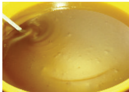
Wenn der Honig diesen Perlmuttschimmer zeigt, aber noch fließfähig ist, ist der richtige Zeitpunkt zum Abfüllen gekommen.

Als Rührgeräte kommen Handrührgeräte, Rührgeräte für Bohrmaschinen und spezielle Rührgeräte zum Einsatz. Die Rührgeräte müssen aus lebensmittelechtem Edelstahl bestehen. Beim Rühren darf keine Luft eingegrührt werden. Auch muss bei