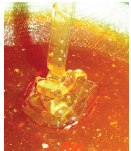
Wenn sich der Honig im Sieb aufeinander faltet, ist der Wassergehalt in der Regel in Ordnung.

Üblicherweise wird zur Honigentnahme Wabe für Wabe entnommen und die Bienen abgekehrt. Diese Arbeit ist für den Imker bei größeren Völkerzahlen körperlich anstrengend und für die Bienen mit Räubereigefahr verbunden. Mit einer Bienenflucht geht es wesentlich leichter. Voraussetzung ist jedoch die Verwendung eines Absperrgitters. Durch die Bienenfluchten können die Bienen den Honigraum verlassen, finden aber den Rückweg nicht. Innerhalb einiger Stunden ist der Honigraum nahezu bienenleer. Ist der Honig reif, wird die Bienenflucht am besten früh am Morgen eingelegt, damit kein neuer Nektar in den Honigraum gelangt. Einige Stunden später kann der Honigraum abgenommen werden. Da das Volk dabei nicht offen ist, besteht auch keine Räubereigefahr, und die Ernte ist vorbei, ehe die Bienen dies bemerken. Auf keinen Fall sollte der gesamte Vorrat entnommen werden. Dem Bienenvolk