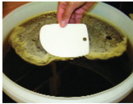
Die Schaumschicht auf der Oberfläche wird nach der Klärphase abgezogen.

Aus der Schleuder läuft der Honig durch ein Doppelsieb (Grob- und Feinsieb) in einen Eimer. Ein noch besseres Ergebnis erzielt man mit einem sehr feinen Nylonspitzsieb. Das Spitzsieb wird dazu in einem Stativ über dem Klärgefäß oder Honigeimer angebracht. Zum Klären lässt man den Honig einige Tage bei mindestens Zimmertemperatur stehen und schöpft dann die sich bildende Schaumschicht ab. Diese Schaumschicht besteht aus Luftbläschen und feinsten Wächsteilchen.