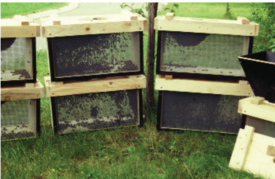
Nur mit Bienen und einer begatteten Königin wird ein Kunstschwamm gebildet. Hierfür eignen sich Bienen aus dem Honigraum ideal.